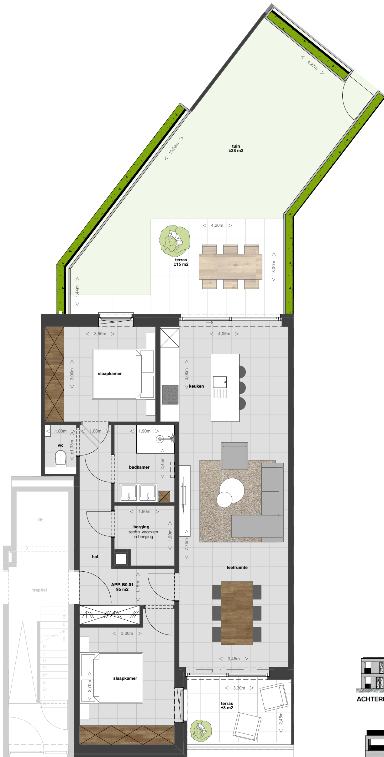
GELIJKVLOERS standaard uitvoering